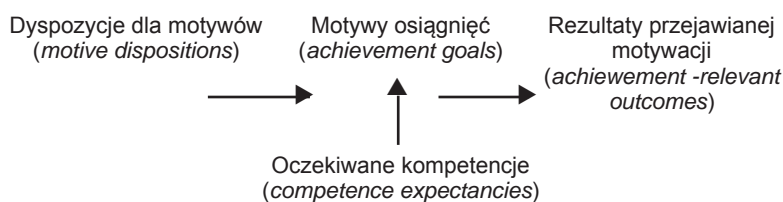
Ryc. 2. Hierarchiczny model zmierzającej do celu i unikającej celu motywacji osiągnięć (Elliot i in., 1997, s. 220)

W modelu tym dyspozycje dla motywów (nadające kierunek: unikanie bądź dążenie do celu), czyli motywacja osiągnięć oraz strach przed porażką reprezentują wyższy porządek konstruktów motywacji. Motywy osiągnięć, czyli: motywy mistrzostwa oraz motywy porównania